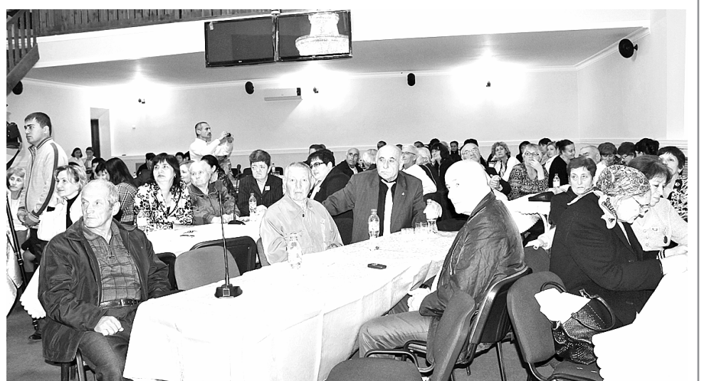
Встреча комсомольцев Ардонского района разных поколений.

Образцы трудовой доблести показали комсомольцы и молодежь района в годы восстановления и развития народного